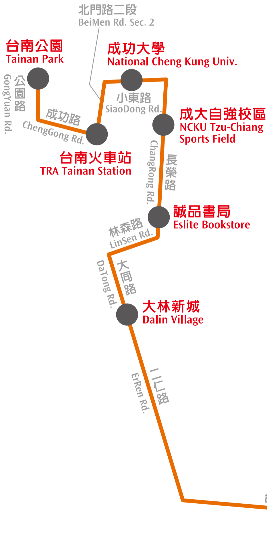
免費接駁車發車時刻表 Free Shuttle Bus Timetable